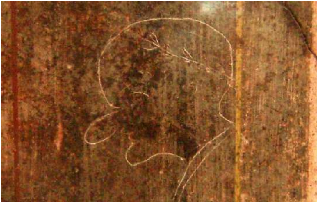
Grafit karikatura antičnega pompejskega politika.

Grafit politika iz antičnih Pompejev je verjetno najstarejša karikatura v zgodovini. Sicer so se šele umetniki visoke renesanse naučili, kako ustvariti "popolno podobo" in so jo lahko začeli (karikaturno) razstavlјati. Karikature so lahko ena najbolj populističnih oblik umetnosti, vendar so kot figurativne risbe običajno prav tako spretno in vplivnejše od večine portretnih slik. So upodobitve, ki poenostavljeno ali pretirano prikazujejo značilnosti svojega predmeta s skicami, potezami s svinčnikom ali z drugimi umetniškimi risbami.