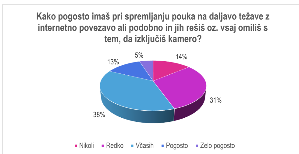
Grafikon 2 : Prikaz pogostosti težav med poukom s povezavami

Odgovori na vprašanje, kako pogosto imajo dijaki pri spremljanju pouka na daljavo težave z internetno povezavo in težave podobne tem, ki jih rešujejo tako, da izključijo kamero, prikazani so v Grafikonu 2, nam kažejo, da se to občasno dogaja tretjini dijakov in pogosto nekaj več kot desetini dijakov, pri 5% vseh so tovrstne težave zelo pogoste.